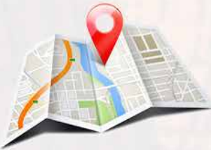
Système d'information géographique