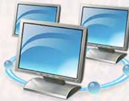
Réseaux Informatique & Maintenance